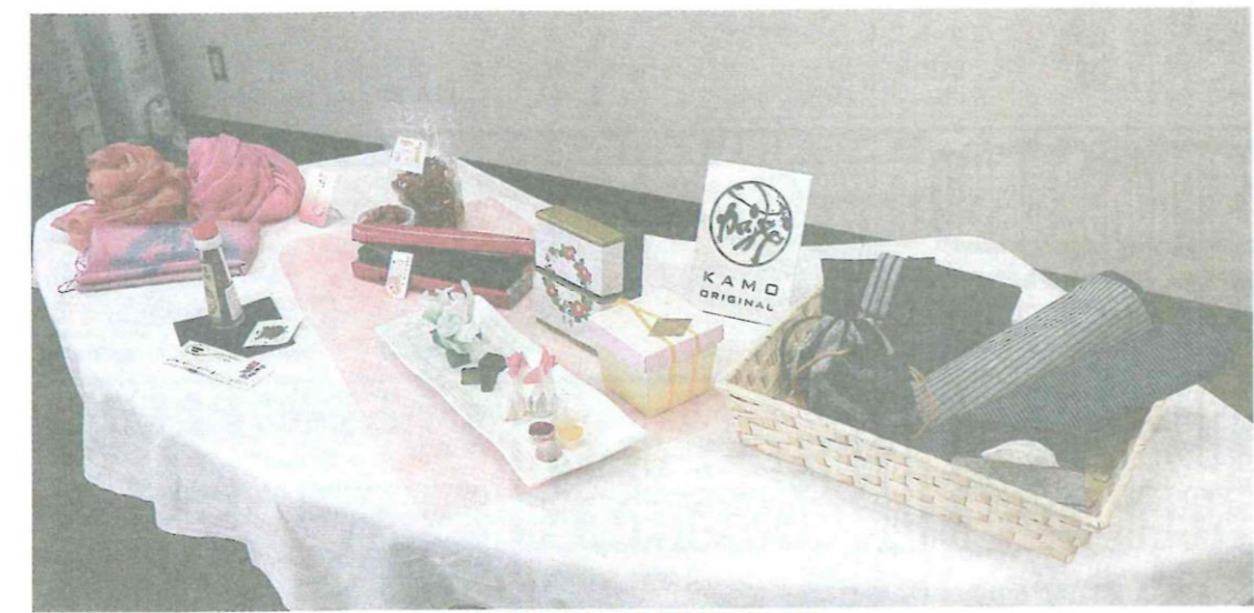
加茂オリジナル推奨品の一部