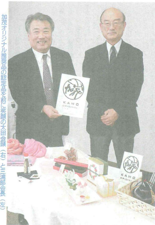
加茂オリジナル推奨品の認定を前に笑顔の太田会頭(右)と三浦部会長(左)