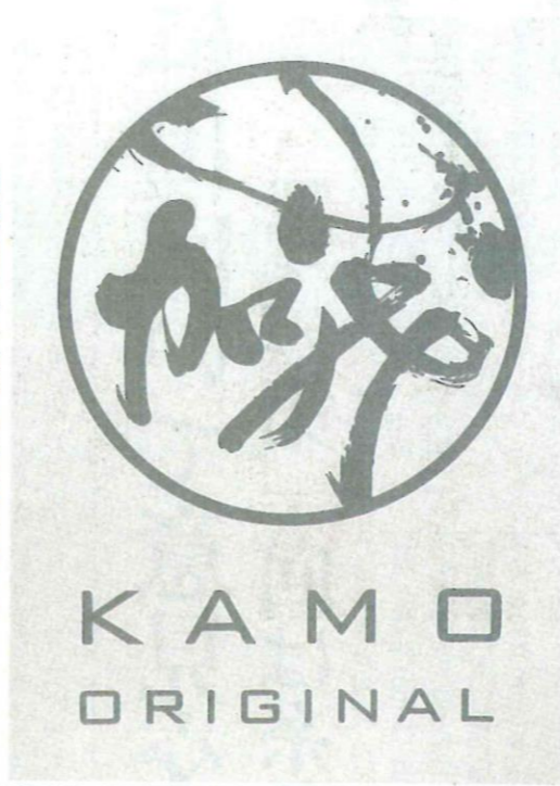
加茂オリジナル推奨品の認定ロゴマーク

「加茂オリジナル推奨」とともに、会員事業所のものや体験できるものも、何よりもオリジナルの魅力を高めるため、オリジナル性のある商品やサービスを広くPRする。認定基準は、市内で製造、生産、加工されているものや体験できるもの