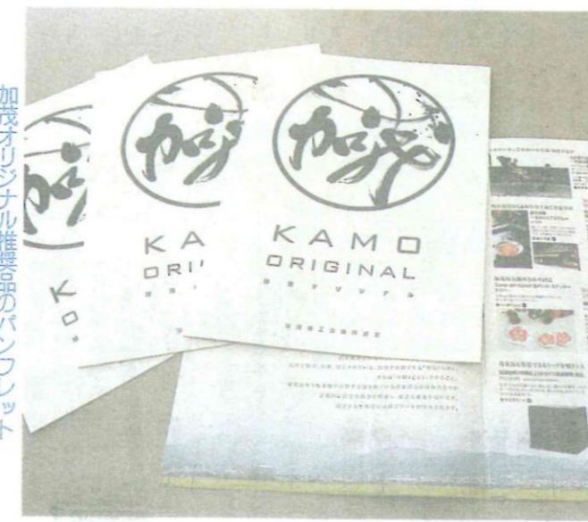
加茂オリジナル推奨品のパンフレット

「加茂オリジナル推奨」とともに、会員事業所のものや体験できるものも、何よりもオリジナルの魅力を高めるため、オリジナル性のある商品やサービスを広くPRする。認定基準は、市内で製造、生産、加工されているものや体験できるもの